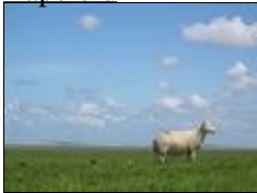
Schaf auf Deich