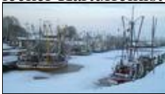
Küstenimpression im Winter