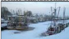
Küstenimpression im Winter