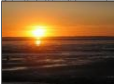
Sonnenuntergang im Watt