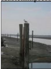
Möwe bei Ebbe