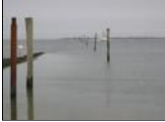
Fähre bei Flut