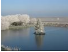
Alter Hafen im Winter