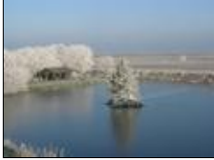
Alter Hafen im Winter