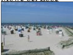
Strand im Sommer