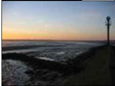
Hafenfeuer bei Sonnenuntergang