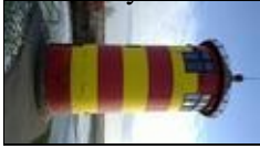
Küstenimpression Pilsumer Leuchtturm