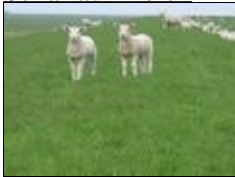
Schafe auf dem Deich